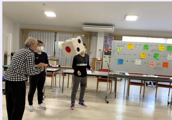
すごろくナンバーワンは誰だ！

今回行った行事は、大きなさいころを振りながら行うオリジナルすごろくを行いました。すごろくのマスには様々なお題が書かれています。がシンプルに大きなさいころを転がすことを楽しんでおられる方も多くいました。