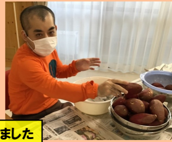
仕込みから皆さんに頑張ってくださいました