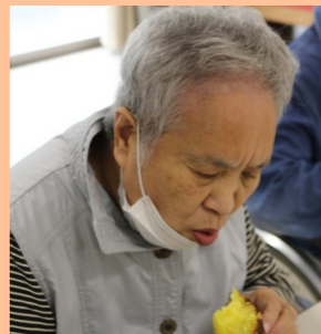
食べるのに夢中です♪