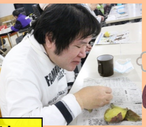
美味しいものはやはり別腹です♡