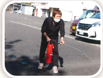
消火器の使い方を確認