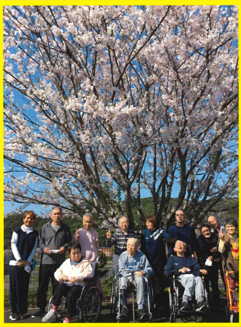
桜をバックにみんなで一枚パシャリ!!