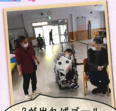
2が出ればゴールだ!!

グループホームつわぶきの家 施設の周辺にも桜が咲き、利用者も運動を兼ねて、散歩を され桜見を楽しまれています。 生活介護事業所では、日々のリハビリとレクリエーションに取り組まれ、上の写真はその時の利用者様の様子です。皆様、楽しそうに参加されており、今後も元気に楽しく過ごして戴ければと思います。