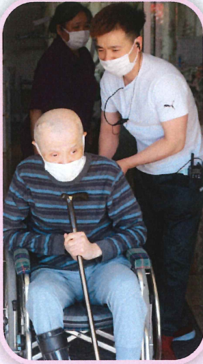
ギア支援員 これからも石蔭の里で一緒に頑張りましょう！

利用者さんと人生や家族・仕事について話したことが、同僚の方達が飲みを誘ってくれる時です。心優しいギア支援員ですので、この先も外国人スタッフのリーダーの一人として期待しています。